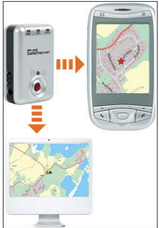
KARTINFO: Når båten flyttes får du SMS med link til kart og posisjon, i tillegg til at du kan spore på nett.